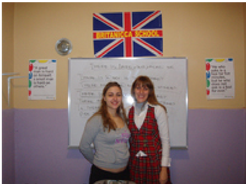
Priprema za IELTS ispit